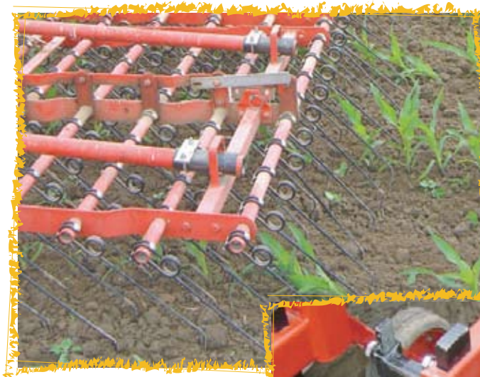
Ci-contre herse étrille sur maïs

Cette comparaison a permis d'établir des données présentées dans cette fiche qui sont les résultats de stratégies et de pratiques de désherbage mises en œuvre par l'exploitant. Les matériels utilisés sont la herse étrille et la bineuse.