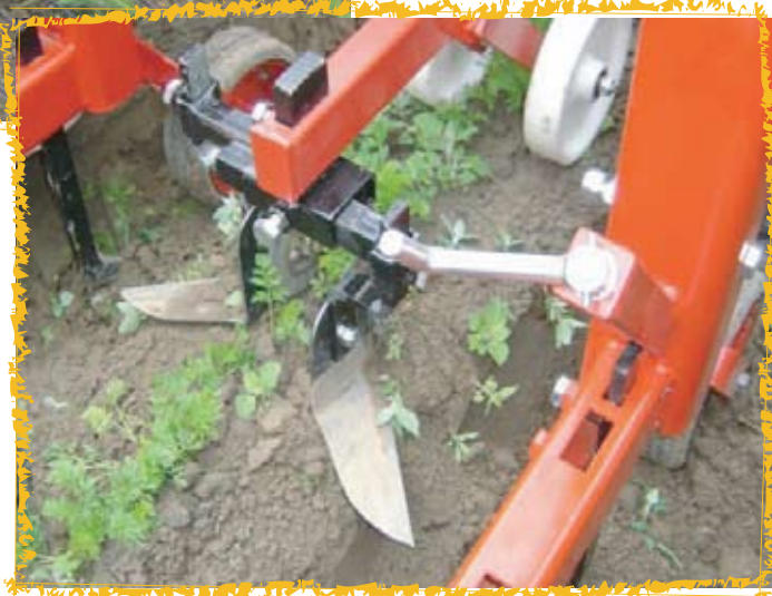
Ci-contre socs de bineuse sur carottes